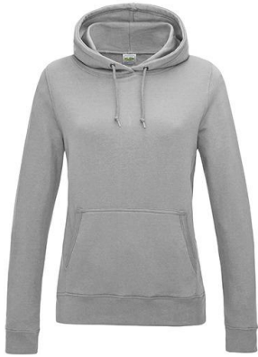
College Hoodie (girls)