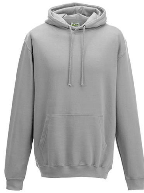
College Hoodie (boys)